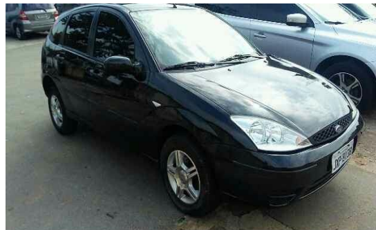
SUPREMA VISTORIA LTDA - ME DATA: 17/05/2017 HORA: 12:27:57 LAT: -23,582069 LONG: -46,724959