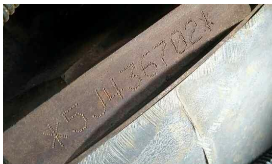
SUPREMA VISTORIA LTDA - ME DATA: 17/05/2017 HORA: 12:29:01 LAT: -23,582533 LONG: -46,724468