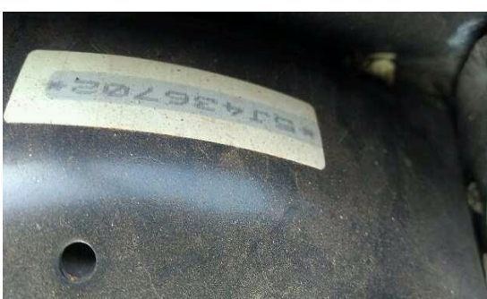
SUPREMA VISTORIA LTDA - ME DATA: 17/05/2017 HORA: 12:28:30 LAT: -23,582267 LONG: -46,724353