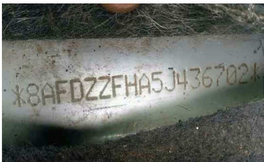
SUPREMA VISTORIA LTDA - ME DATA: 17/05/2017 HORA: 12:32:46 LAT: -23,584495 LONG: -46,724431