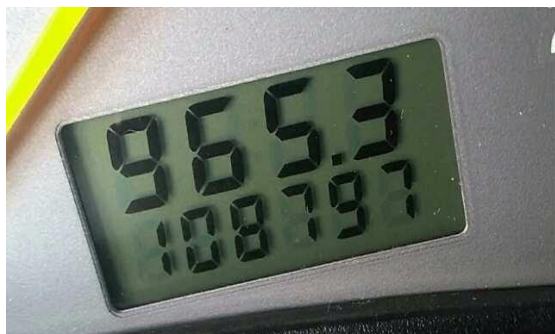
SUPREMA VISTORIA LTDA - ME DATA: 17/05/2017 HORA: 12:26:45 LAT: -23,582256 LONG: -46,724393