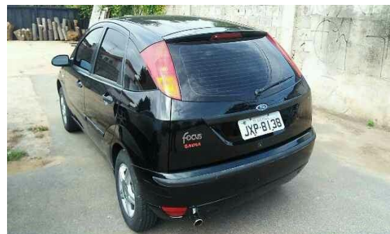
SUPREMA VISTORIA LTDA - ME DATA: 17/05/2017 HORA: 12:27:40 LAT: -23,581967 LONG: -46,724771