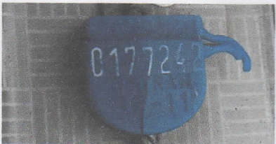
SUPREMA VISTORIA LTDA - ME DATA: 08/06/2017 HORA: 11:35:35