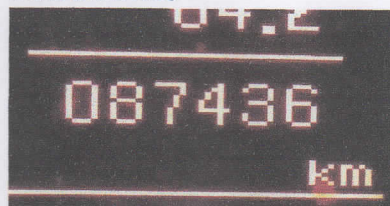
SUPREMA VISTORIA LTDA - ME DATA: 08/06/2017 HORA: 11:35:58