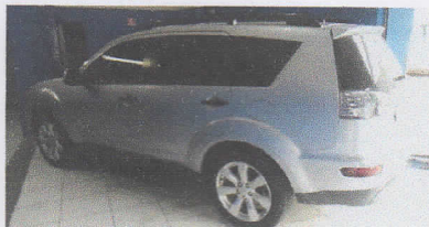
SUPREMA VISTORIA LTDA - ME DATA: 08/06/2017 HORA: 11:35:23