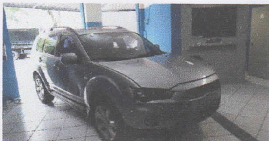
SUPREMA VISTORIA LTDA - ME DATA: 08/06/2017 HORA: 11:35:12