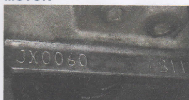
SUPREMA VISTORIA LTDA - ME DATA: 08/06/2017 HORA: 11:38:49